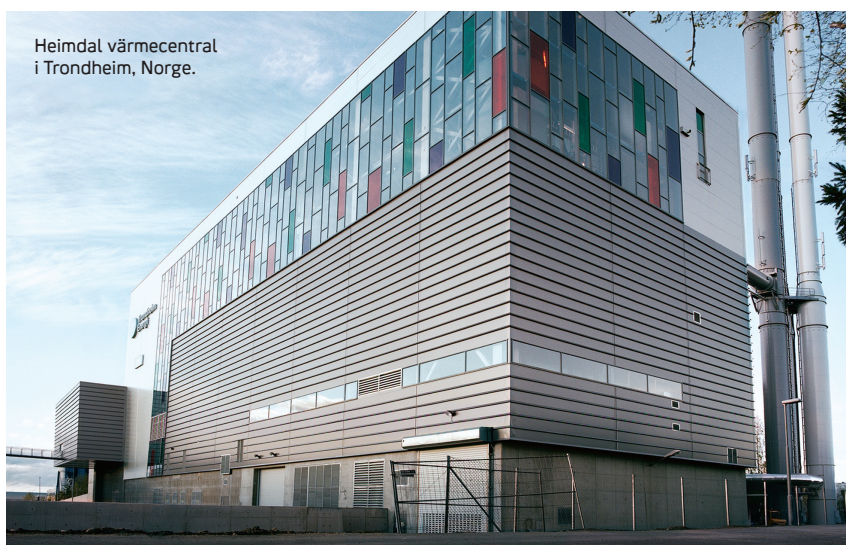
Heimdal värmecentral i Trondheim, Norge.

Det avfall som förbränns vid anläggningen är till stor del förnybar energi och detta gör att användning av olja och elektricitet för uppvärmning kan minskas hos kunderna. Flera större näringsfastigheter, skolor och